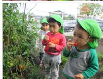
畑でトマトをパクリ！